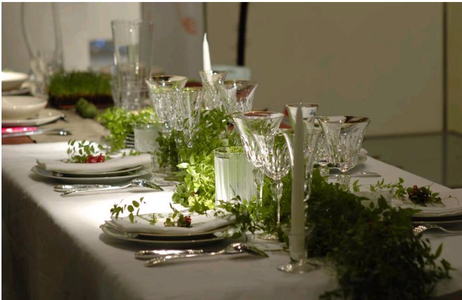
Atelier «Arts de la table»

Cours de «French étiquette», «galanterie» ou encore «arts de la table»... les écoles donnent règles et conseils aux particuliers et professionnels. Parmi les établissements les plus réputés, citons La Belle École qui offre des ateliers interactifs «sur mesure» pour découvrir les arts culinaires, les arts de la dégustation, les arts floraux, l'art de recevoir ou encore l'étiquette! Et comme le cadre a de l'importance, les cours se déroulent dans des caves à vins et des hôtels de luxe!