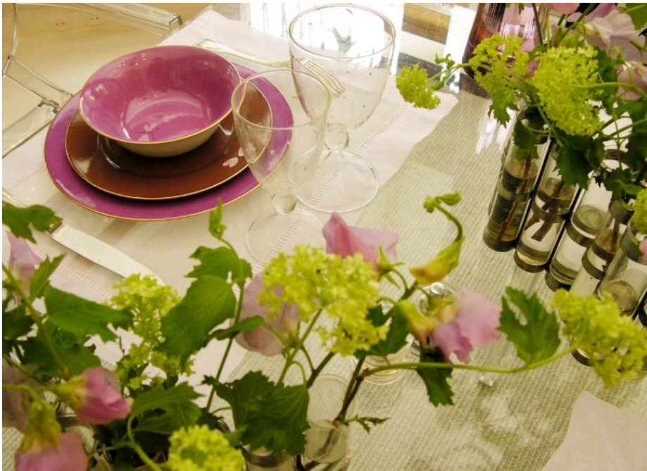
Atelier «Art de recevoir»

Le succès de ces écoles pourrait être expliqué par plusieurs raisons: la fracture du noyau familial, la mode du coaching ou encore la crise, qui précipiterait cadres dynamiques, chômeurs et même étudiants à des cours de savoir-vivre... en entreprise!